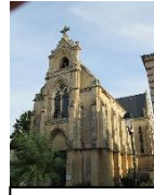
CHAPELLE de LUC