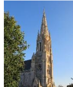
SAINT AUBIN S/MER